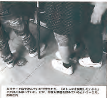
「ストレスを軽減したいから」として、子どもが、何れも親を必要としている。...